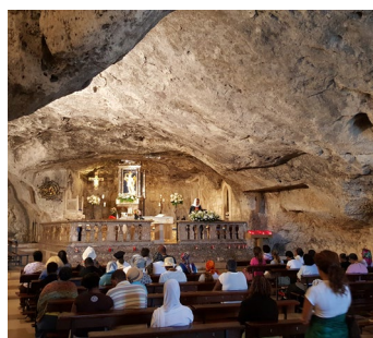
Gruta de San Miguel Arcángel