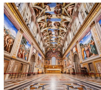
la Capilla Sixtina

y olivares, disfrutando de vistas panorámicas. Llegamos a Monte Cassino, una ciudad fundada por San Benito en el año 529. Realizaremos un recorrido por la magnífica Abadía de Monte Cassino, donde se fundó la Orden Benedictina. También visitaremos la Iglesia de San Pedro y San Pablo. Luego continuamos hacia Roma. Cena y alojamiento en tu hotel.