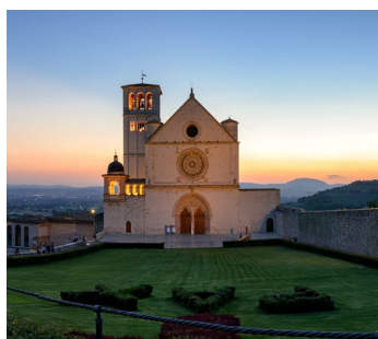
Basílica de San Francisco